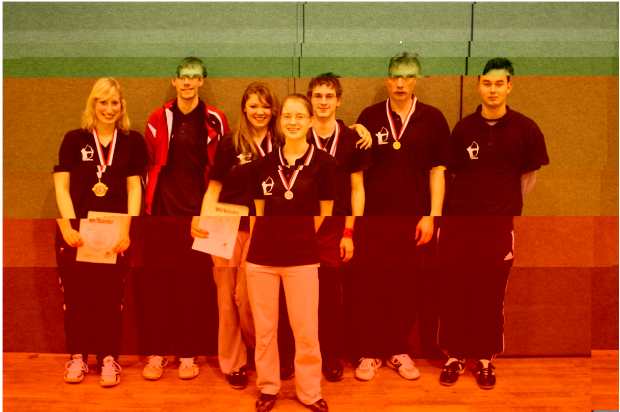
PSV Frankfurt 90 e.V. alle Starter zur Landesmeisterschaft